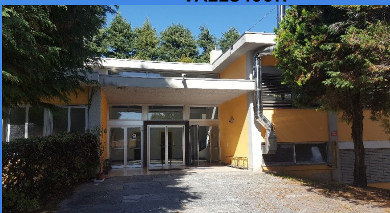
Scuola A. Manzoni, Solbiate A. VAEE84003X