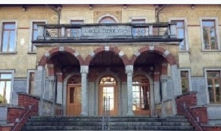
Scuola E. Fermi, Carnago VAEE840041