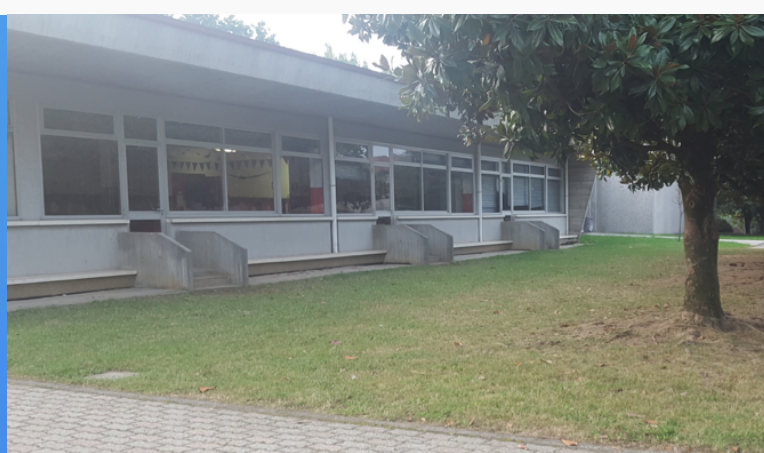
Scuola C. Battisti, Oggiona VAEE84001T